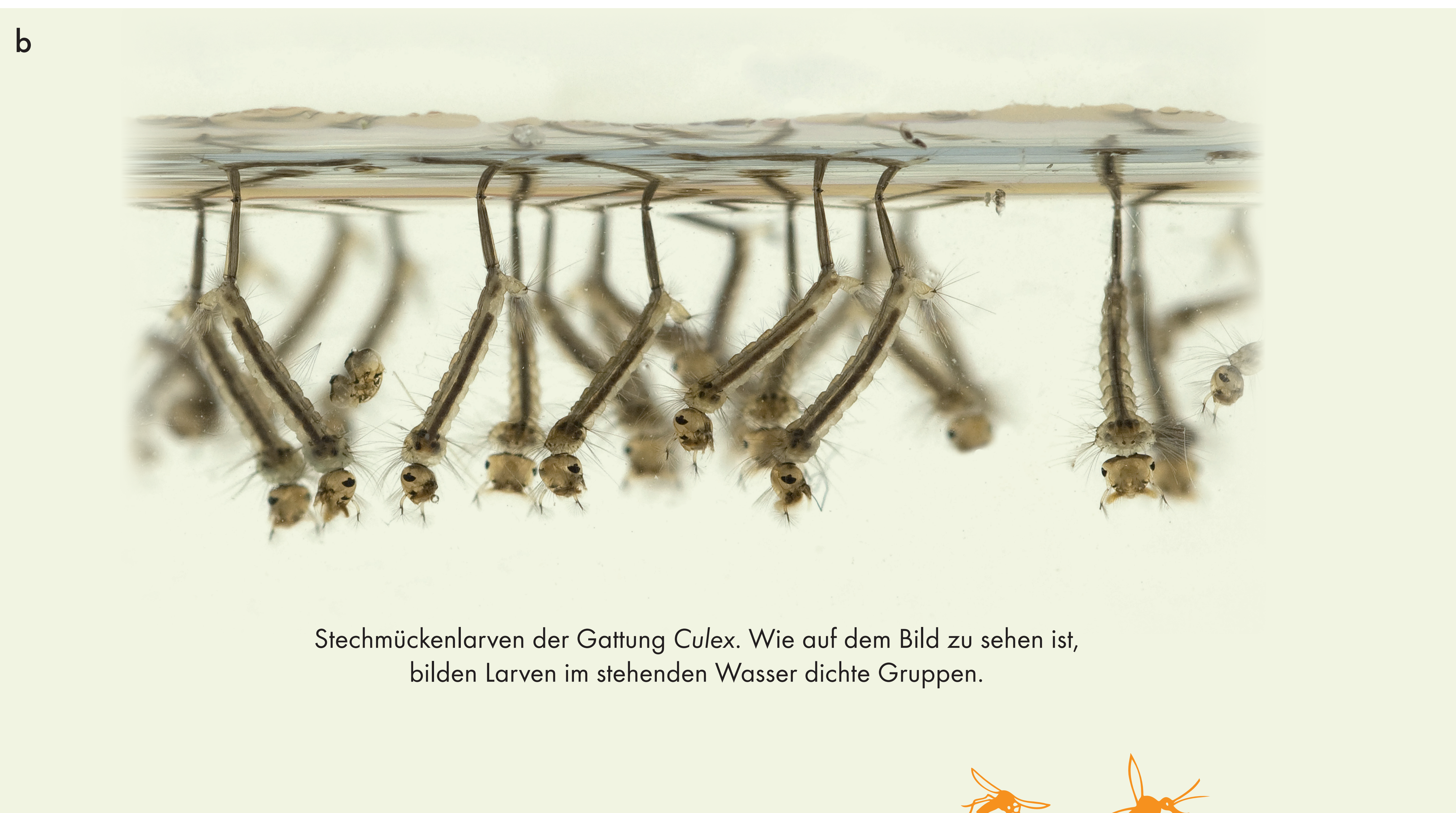
Stechmückenlarven der Gattung Culex . Wie auf dem Bild zu sehen ist, bilden Larven im stehenden Wasser dichte Gruppen.